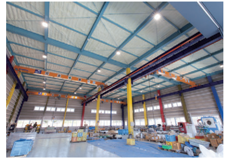
新工場内観(ステンレス加工場)