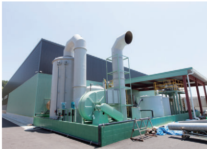
環境に配慮した最新鋭の排水処理施設

配管設備もステンレスを用いることで、長寿命かつメンテナンス費用の抑制効果が期待でき、結果として人・環境にやさしくすることが可能です。