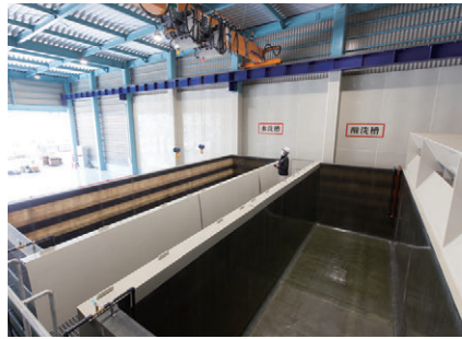
九州最大級の酸洗設備